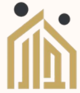
جمعية دار للإسكان بعرعر Dar Housing Association in Arar